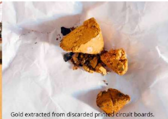
Gold extracted from discarded printed circuit boards.