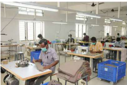
करूर में सिलाई इकाइयां