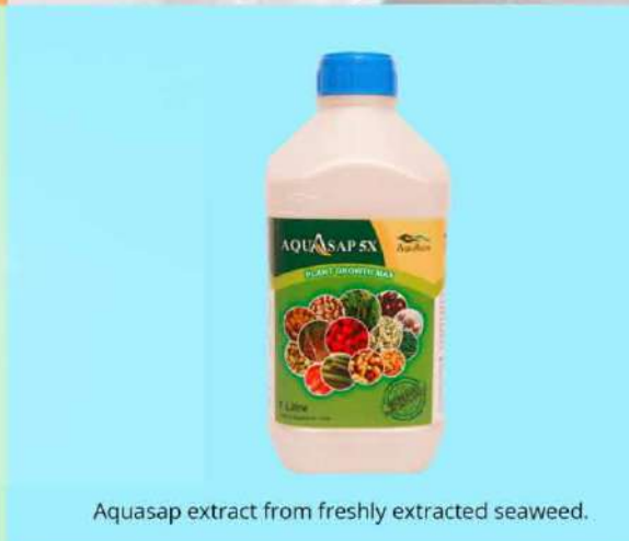
Aquasap extract from freshly extracted seaweed.

टाइफैक सिडबी प्रौद्योगिकी इनोवेशन कार्यक्रम (सृजन) से झलकियां