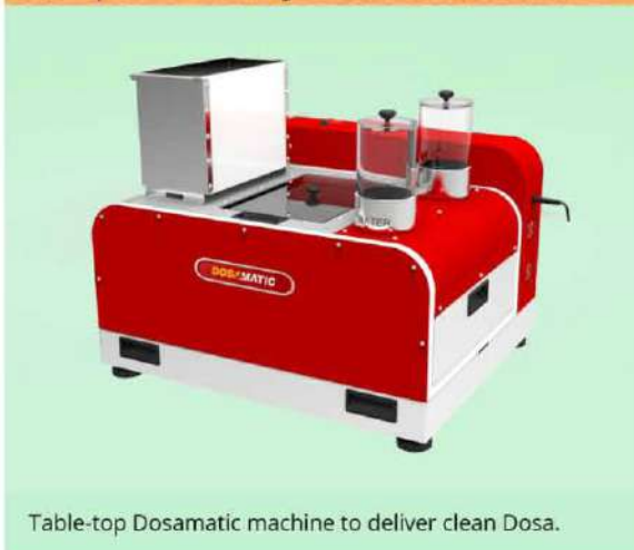
Table-top Dosamatic machine to deliver clean Dosa.