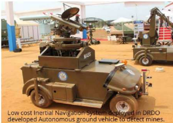
Low cost Inertial Navigation System deployed in DRDO developed Autonomous ground vehicle to detect mines.

मेसर्स मिलेनियम रबर टेक्नोलोजीस प्रा.लि., त्रिशूर, केरल को उनके इनोवेटिव उत्पाद डबल रोलर कॉटन गिनिंग मशीनों के लिए पर्यावरण मित्र सेल्फ ग्रूविंग रबर रोलर के लिए एम.एस.एम.ई.-युनिडो क्लीनटेक प्रोग्राम 2015 के टॉप छह फाइनलिस्टों में चुना गया ।