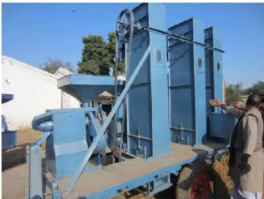
रक्सौल में निर्मित ट्रैक्टर टॉप मिनी राइस मिल